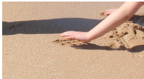
Palpando diversas texturas