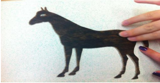
Cuentos con imágenes con relieve