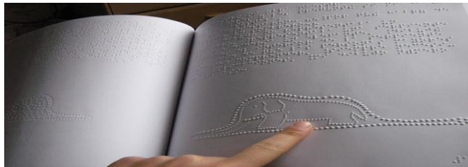
Cuentos hechos en Braille