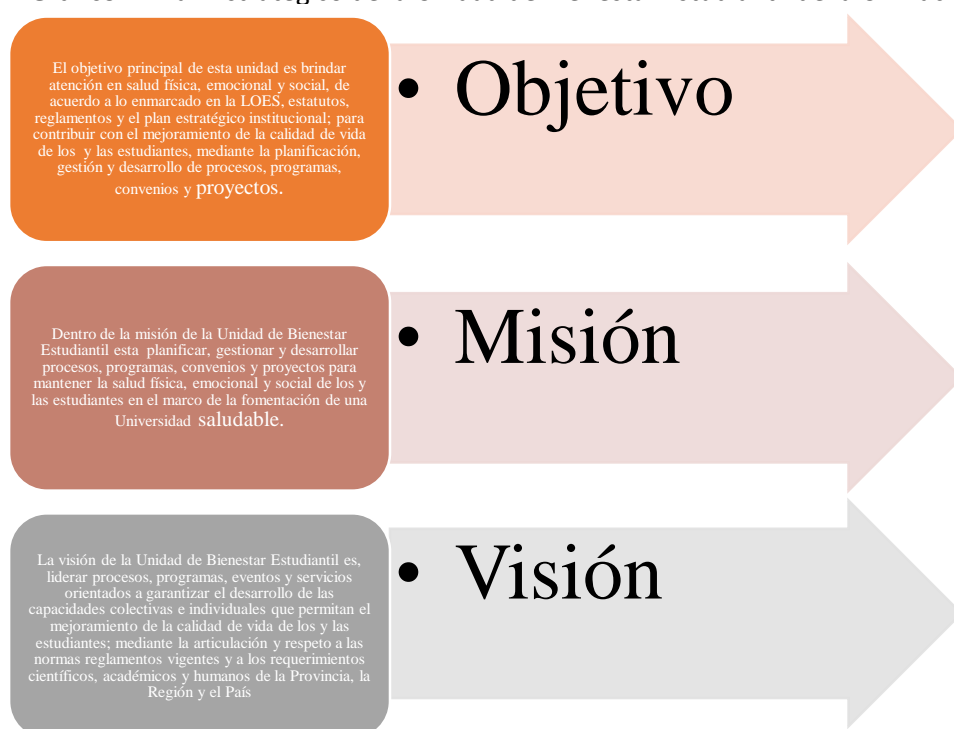
Grafico 2. Plan Estratégico de la Unidad de Bienestar Estudiantil de la UTMach

Es a partir de la administración actual de la UTMACH, donde surgen cambios significativos, pasando a denominarse Unidad de Bienestar Estudiantil, mejorando su infraestructura e incrementando servicios, convirtiéndose así en una de las 5 mejores unidades de bienestar estudiantil a nivel nacional.